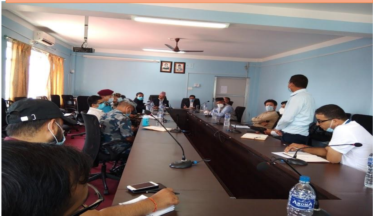
कोभिड- १९ संकट व्यवस्थापन केन्द्रको बैठक