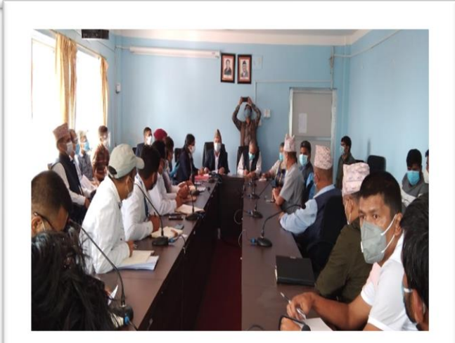
पूर्वप्रधानमन्त्री माननीय डा. बाबुराम भट्टराईको उपस्थितिमा विकास सम्बद्ध कार्यालयहरूसंग सम्पन्न समन्वय बैठक