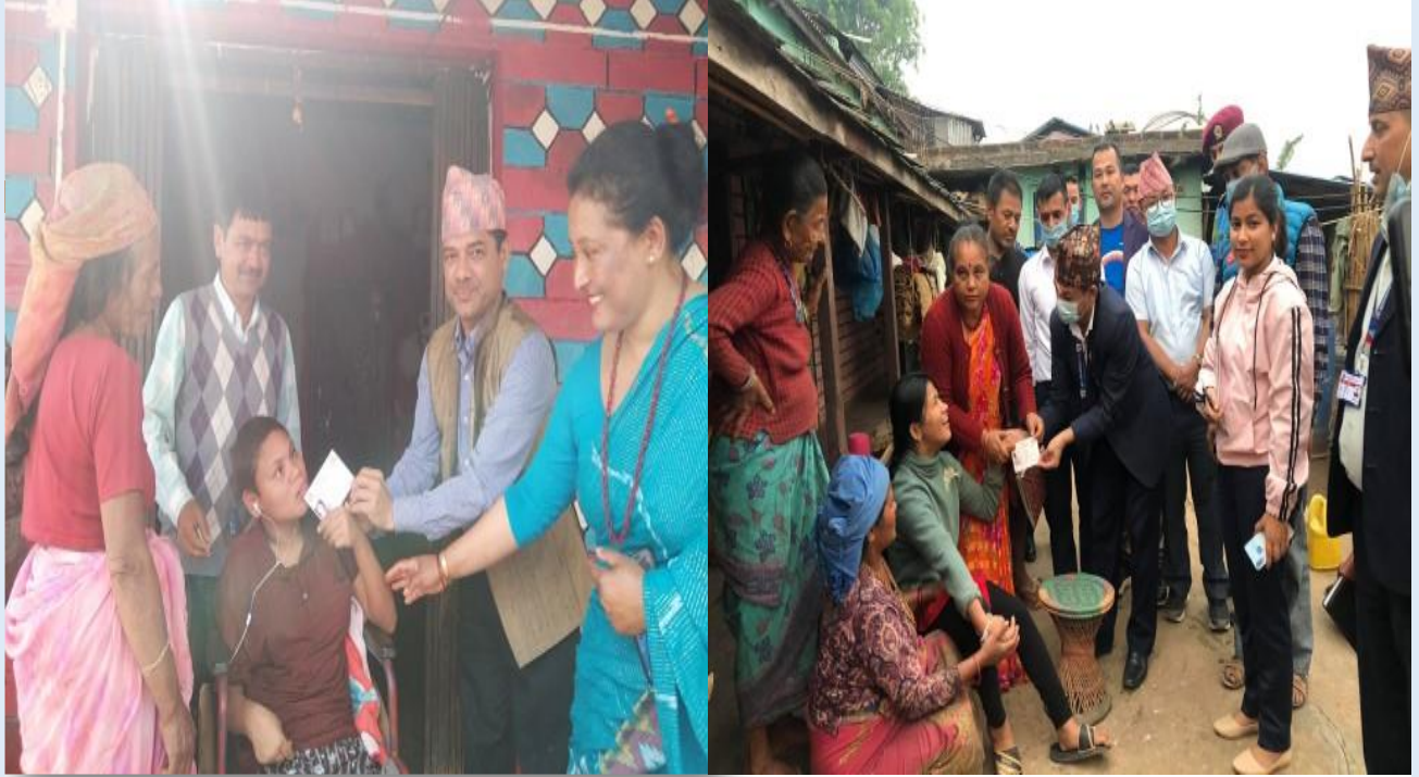
प्र.जि.अ.बाट अपाङ्गता भएका व्यक्तिहरूलाई घरमै गई नागरिकता वितरण कार्य हुदैँ