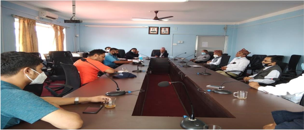
यातायात व्यवसायीहरूसंगको समन्वय बैठक