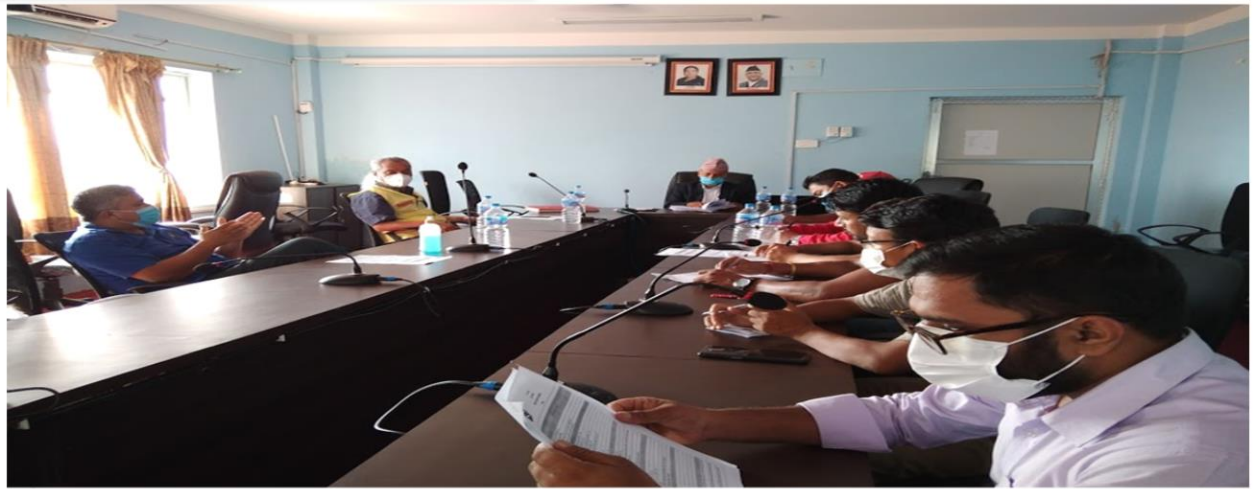
जिल्लाका क्रियाशिल पत्रकारहरूसंगको पत्रकार भेटघाट कार्यक्रम