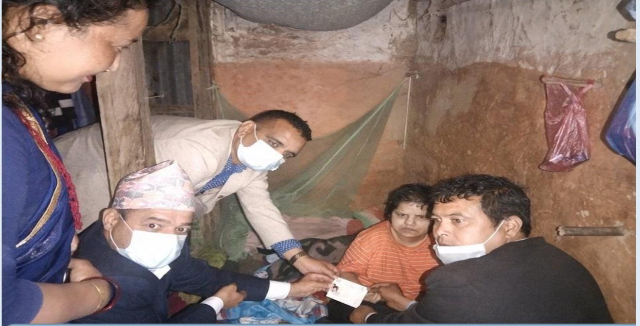
प्र.जि.अ.बाट अपाङ्गता भएका व्यक्तिहरूलाई घरमै गई नागरिकता वितरण कार्य हुदैँ