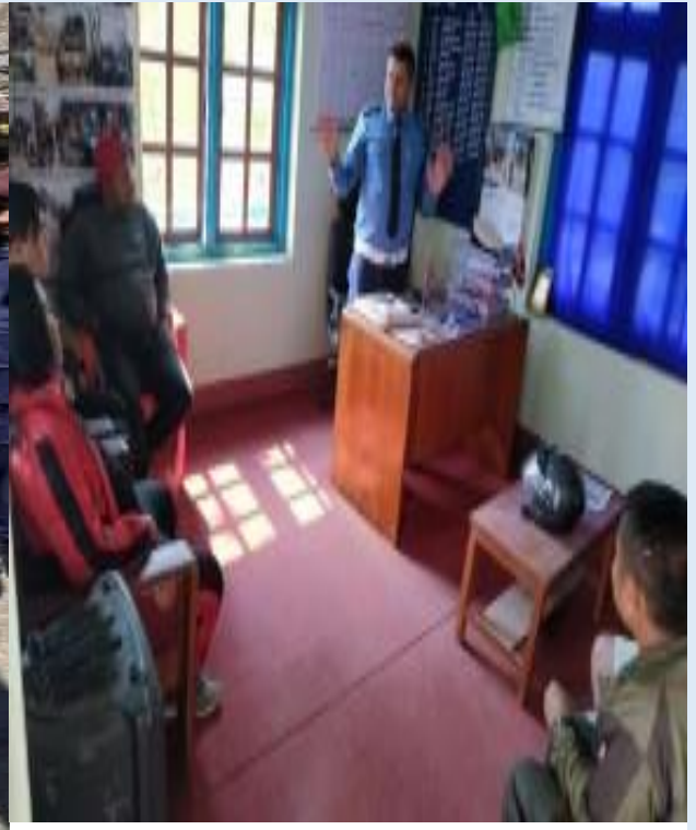
गैहकानूनी तरिकाले भाडा उठाई यात्रुहरू बोक्ने निजी सवारी साधनहरूलाई कारवाही गर्दै प्रहरी