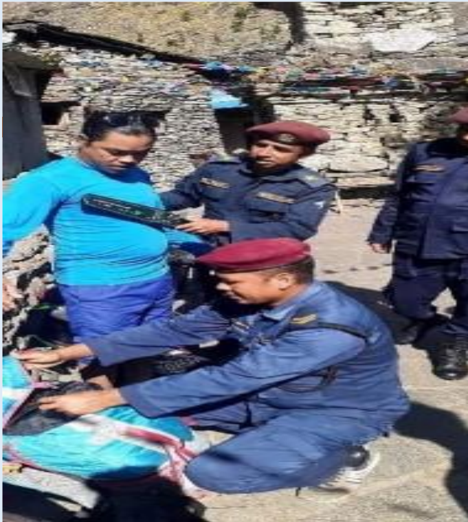
गोरखाको उत्तरी भेगमा रहेको प्रहरी चौकी जगतबाट मेटल डिटेक्टरवाट चेक जाँच गर्दै